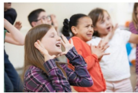
© Tal'en scène - ateliers techniques théâtrales, Taluyers