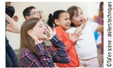
ateliers techniques théâtrales, Taluyers