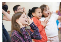
© Tal'en scène : ateliers techniques théâtrales, Taluyers