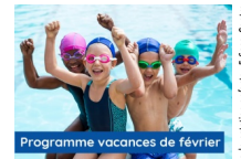
© Stages de natation enfants : 5-6ans_Centre Aquatique-LESBASSINSde l'Aqueduc_Mornant