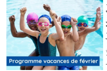
© Stages de natation enfants : 5-6ans_Centre Aquatique-LESBASSINSde l'Aqueduc_Mornant