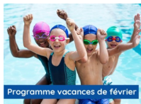
©Stages de natation enfants : 5-6ans, Centre Aquatique Lesbassinsde l'Aqueduc, Mornant