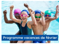
©Stages de natation enfants : 5-6ans, Centre Aquatique Lesbassinsde l'Aqueduc, Mornant